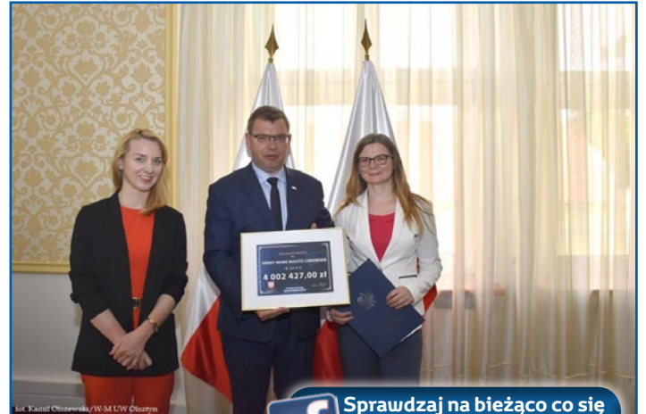
Inf. Kamila Olszewska/W-M Lubawskie

Możliwość podłączenia do kanalizacji sanitarnej nastąpi z chwilą wybudowania w Jamielniku oczyszczalni ścieków.