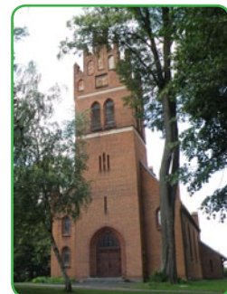
kościół w Gryźlinach

W latach 1938-1954 Gryźliny wchodziły w skład gminy Nowy Dwór Bratjański, która została zniesiona w 1954 roku wraz z reformą wprowadzającą gromady w miejsce gmin. Gromada Gryźliny (w jej skład wchodziły również Bagno, Chrośle, Jamielnik i Radomno) funkcjonowała do końca 1972 r., z początkiem nowego roku wieś została włączona do nowopowstałej gminy Nowe Miasto Lubawskie. Stan ten utrzymał się również po reformie samorządowej 1990 roku.