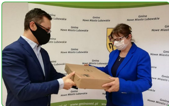
Przekazanie laptopów – UG Mszanowo

Wyniki ankiety przeprowadzonej wśród uczniów naszych szkół oraz ich rodziców pokazują, że zdecydowana większość