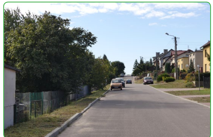
ul. Okrężna w Bratianie