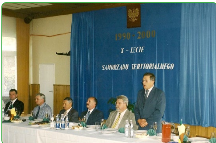
10-lecie Samorządu – była Sala Narad UG