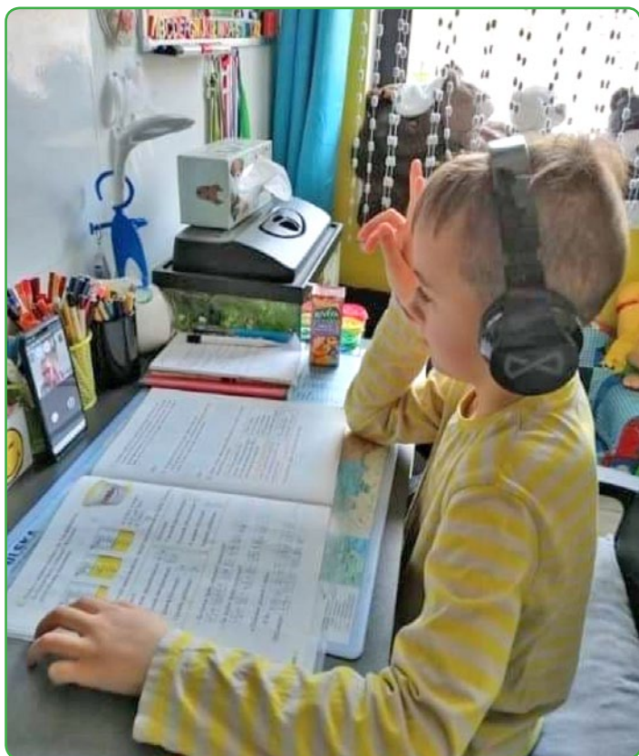
Nauka zdalna SSP w Tylicach

Nauczyciele i uczniowie korzystali z wielu powszechnie dostępnych aplikacji oraz programów edukacyjnych. Wszystkie szkoły w Gminie Nowe Miasto Lubawskie wykorzystują portal Librus, na którym nauczyciele prowadzą zajęcia systematycznie umieszczali opisy zadań dla uczniów oraz odpowiadali na zapytania. Komunikacja przebiegała sprawnie również za pomocą poczty e-mail, platform edukacyjnych, dysków współdzielonych oraz interaktywnie (w czasie rzeczywistym) przy użyciu komunikatorów i aplikacji do komunikacji audio lub audiowizualnej. Ponadto pedagodzy, za pomocą takich