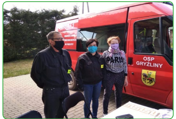
Maseczka dla Mieszkańca w Gryżlinach

Dystrybucją w sołectwach podczas obu akcji zajęli się nasi druhowie Ochotniczej Straży Pożarnej, za co serdecznie im dziękujemy.