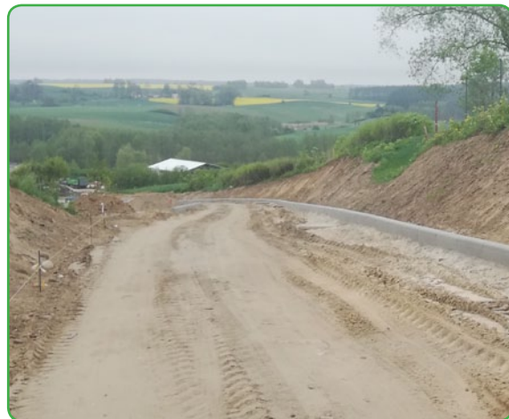
droga gminna w Nowym Dworze

Przewidywany termin zakończenia prac – wrzesień 2020 r.