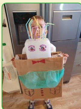
^ Dzień Ziemi w ZS ^ w Bratianie