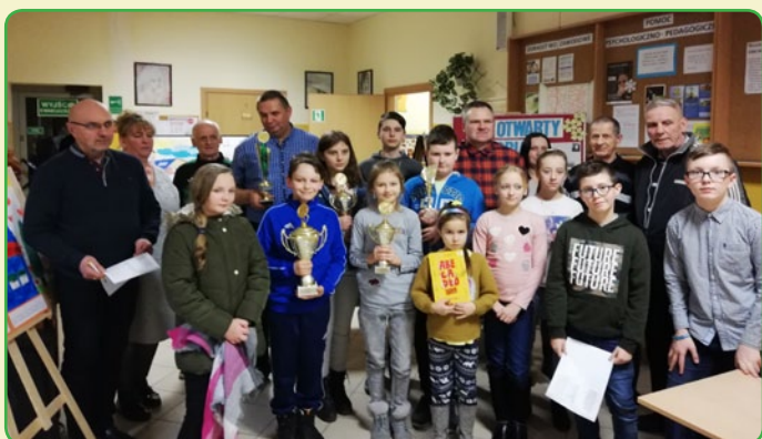
Tradycyjny turniej warszawowy w dniu urodzin patrona szkoły w Gwiżdżinach 02.03.2020 r.

Bezpłatny biuletyn dla mieszkańców Gminy Nowe Miasto Lubawskie Nakład: 2 500 sztuk