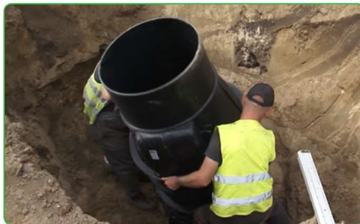
budowa kanalizacji Jamielnik 2019

Cały budżet projektu to niemal 2,3 mln euro, z czego 1,25 mln euro przypada na Gminę Nowe Miasto Lubawskie, która jest liderem projektu, a ponad 1 mln euro na miasto Sowieck. Samo dofinansowanie obejmuje 90% kosztów kwalifikowalnych przewidzianych w projekcie.