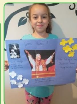
^ Urodziny patrona ^ szkoły w Jamielniku