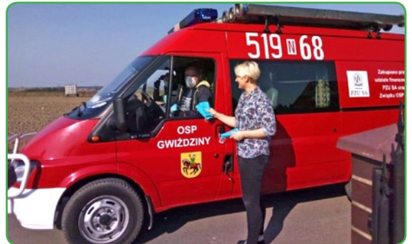
Maseczka dla Mieszkańca w Gwiździnach