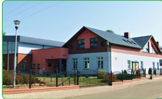
SP w Gwiździnach