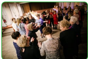
Dzień Kobiet w Mszanowie

Jak zwykle sołectwa odwiedzili również Wójt i Przewodniczący Rady Gminy, aby złożyć Paniom serdeczne życzenia i obdarować kwiatkiem. W tym roku były to goździki – nieodzowny symbol święta kobiet oraz czekoladki, na osłodzenie tego wyjątkowego dnia.