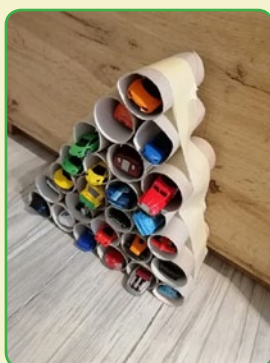
^ Dzień Ziemi w SSP ^ w Tyliczach