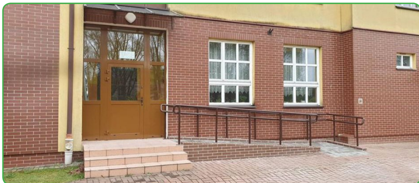
ZS w Bratianie

Zamknięcie placówek oświatowych z powodu koronawirusa nie oznacza, iż nic się w nich nie dzieje. Gmina wykorzystuje ten czas na realizację inwestycji z zakresu infrastruktury oświatowej. Przykładem jest Zespół Szkół w Bratianie, gdzie w ostatnim czasie trwały prace związane z budową placu manewrowego przed starą częścią budynku, remontem wiaty rowerowej oraz budową podjazdu dla osób niepełnosprawnych przed głównym wejściem do szkoły.