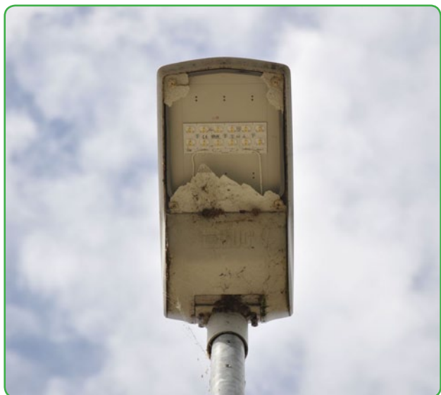
Bezmyślność i głupota

Tylko w ten sposób można podsumować zachowanie grupy młodych ludzi, którzy pod koniec sierpnia uszkodzili 21 lamp oświetleniowych na ścieżce rowerowej w Bratianie i Nowym Mieście Lubawskim.