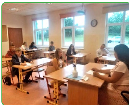
Rozpoczęcie roku w SP w Skarłinie