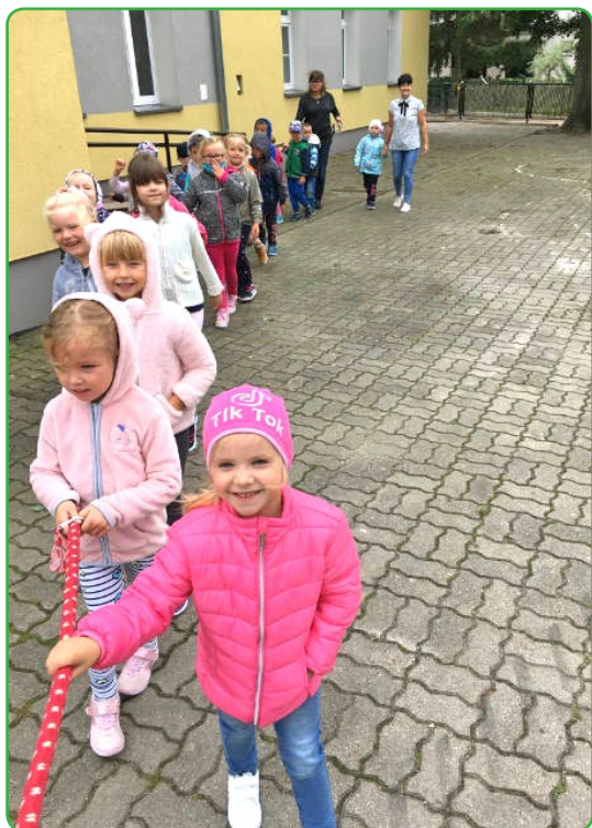
Rok szkolny rozpoczęły też przedszkolaki ze Skarłina