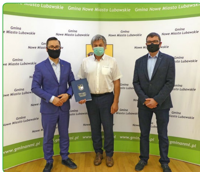
Wójt Gminy z wykonawcami

Procedura przetargowa zakończyła się wyłonieniem wykonawcy, którym została firma „Przem-Gri” Sp. z o.o. z Olsztyna. Przedsiębiorstwo to posiada wieloletnie doświadczenie w budowie tego typu obiektów, zarówno w kraju, jak i za granicą, co pozwala sądzić, iż realizacja inwestycji przebiegać będzie terminowo i bez problemów. Planowany termin ukończenia budowy to lipiec 2021 roku.