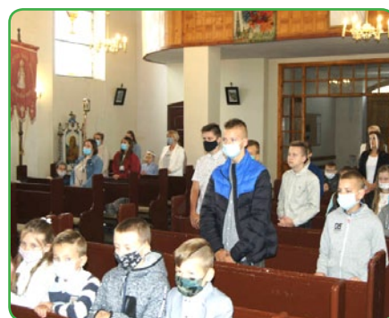
Rozpoczęcie roku w SP w Gwiździnach