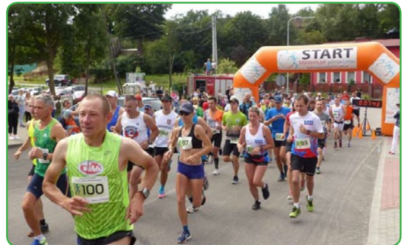
Zawodnicy II Biegu Przełajowego w Radomnie

W ostatnią niedzielę sierpnia, miłośnicy biegania ponownie spotkali się w Radomnie, by wziąć udział w II Biegu Przełajowym im. Ks. Józefa Dembieńskiego. Głównym organizatorem zawodów jest Grupa Radomno Biega, wspomagana przez Gminę Nowe Miasto Lubawskie, KGW Radomno oraz prywatnych sponsorów.