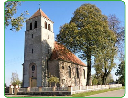
Kościół w Gwiździnach