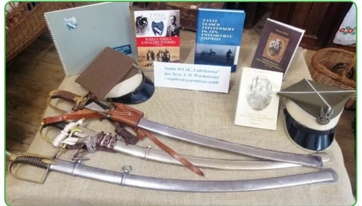
Szabla gen. Waraksiewicza