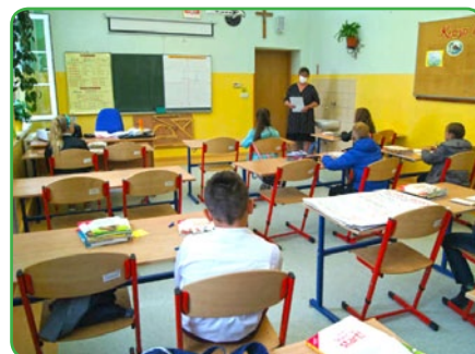
Dyrektor SP w Gwiździnach wita uczniów w klasie