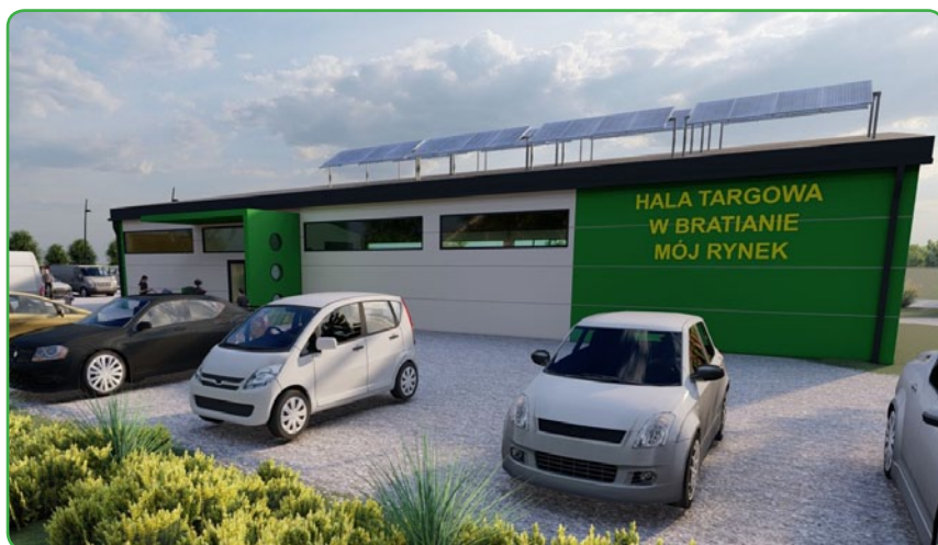
Na targ do Bratiana - wizualizacja

Targ funkcjonowałby dwa razy w tygodniu. W chwili obecnej złożony został wniosek na dofinansowanie inwestycji.