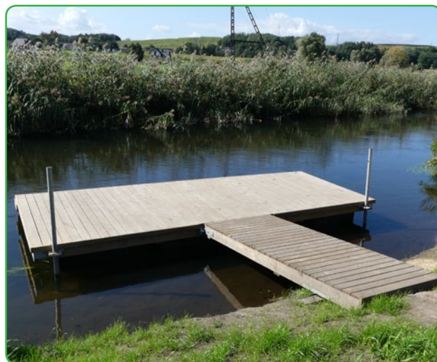
Pomost na Drwęcy

wykonanie pływakowego pomostu na Drwęcy, a także zagospodarowanie placu w jego pobliżu. Dzięki dofinansowaniu, w wysokości ponad 320 tys. zł (wartość całkowita to nieco ponad 400 tys. zł),