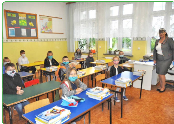
Uczniowie ze Skarłina w szkolnych ławkach

W roku szkolnym 2020/2021 do naszych placówek uczęszcza 654 uczniów w klasach I-VIII. Jest to o 25 uczniów mniej niż w roku poprzednim. Naukę w klasach pierwszych w sześciu szkołach rozpoczęło 67 uczniów. Najmniejsza klasa pierwsza liczy 6 osób. Liczba dzieci w oddziałach przedszkolnych, Zespołach Wychowania Przedszkolnego oraz przedszkolach utrzymała się na podobnym poziomie i wynosi 265.