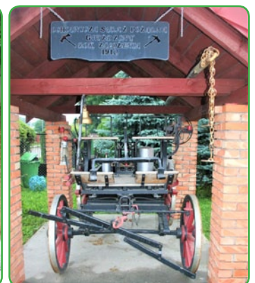
Zabytkowy wóz strażacki