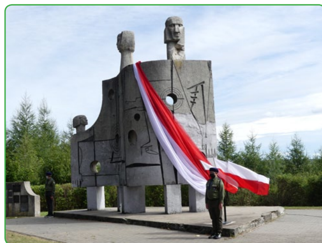
Pomnik w Nawrze