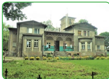
Dwór w Gwiździnach obecnie

Gwiździny to wieś położona ok. 5 km na południowy wschód od Nowego Miasta Lubawskiego. Najstarsza wzmianka o miejscowości pochodzi z roku 1414, kiedy to wojska polskie złupiły te okolice a władze zakonne postanowiły dokładnie wyliczyć powstałe szkody.