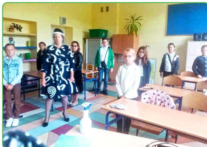
Uczniowie SP w Radomnie w klasie