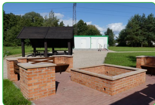
Miejsce na ognisko

Na ukończeniu są już prace związane z budową przystani w Mszanowie w ramach Regionalnego Programu Operacyjnego Województwa Warmińsko-Mazurskiego. Projekt „Gmina Nowe Miasto Lubawskie na straży bogactwa bioróżnorodności” zakładał