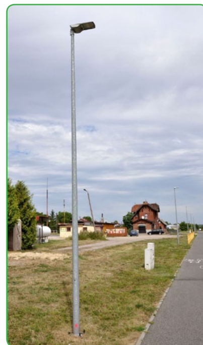
Lampy na ścieżce

Jak się okazało młodzi chuligani strzelali do lamp oświetleniowych z wiatrówek. Powstałe w ten sposób straty oszacowano na kwotę blisko 26 tys. zł. Na szczęście policja bardzo szybko wpadła na trop wandal, którym grozi kara do 5 lat pozbawienia wolności.