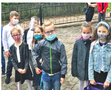
Powitanie uczniów w SP w Radomnie