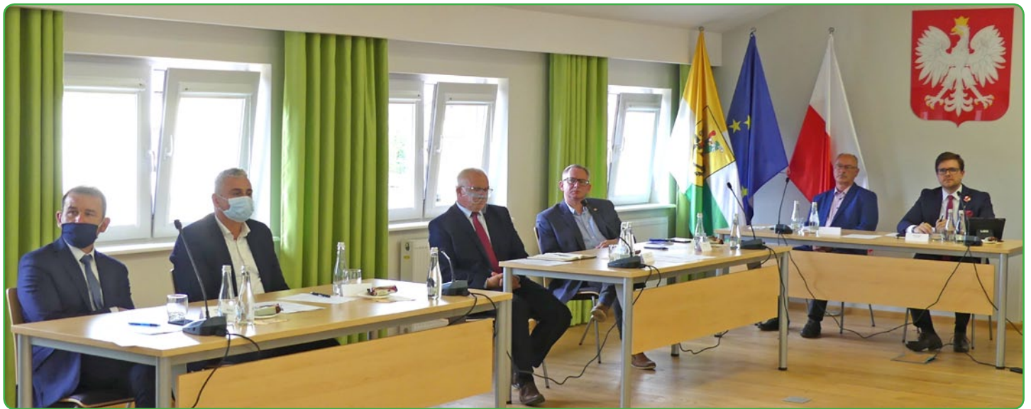
Droga S5 szansą dla powiatu

Wszyscy zaproszeni parlamentarzyści zgodzili się z tym, iż nowa trasa przebiegająca przez historyczną Ziemię Lubawską korzystnie wpłynęłaby na rozwój regionu zarówno pod względem gospodarczym, jak i społecznym. W znacznym stopniu odciążeniu uległby ruch samochodowy na DK 15, którą codziennie przejeżdża kilkanaście tysięcy pojazdów, w tym kilka setek samochodów ciężarowych i dostawczych.