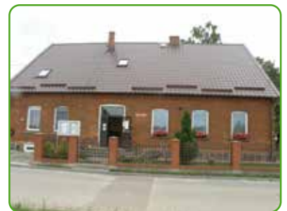
Dawna szkoła - obecnie biblioteka

W ciągu kilku minionych lat zrealizowano wiele inwestycji takich jak budowa dróg, sieć kanalizacji sanitarnej i deszczowej. Na ukończeniu są również prace związane z budową oczyszczalni, realizowanej w ramach projektu Współpracy Transgranicznej Polska-Rosja.