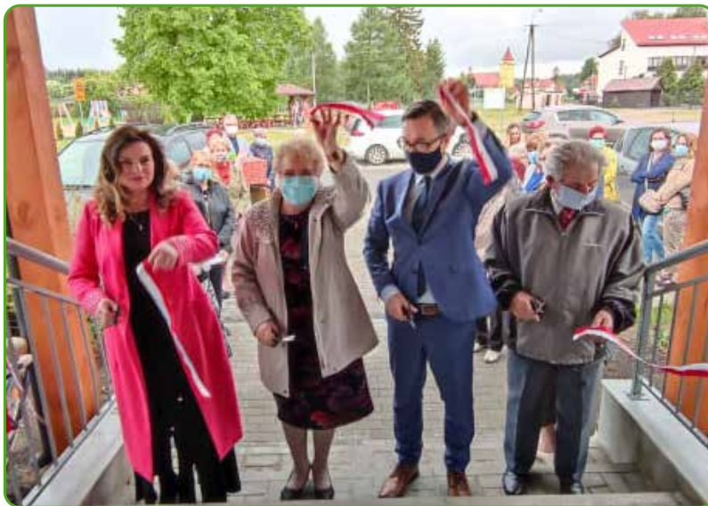
Klub Seniora otwarty

malże gruntowny remont. Adaptację zaplanowano tak, by był on w pełni dostępny dla seniorów, a także przystosowany do potrzeb oraz możliwości osób niepełnosprawnych, dlatego nie zabrakło tam podjazdu oraz łazienek spełniających te wymogi. Seniorzy mają do dyspozycji wiatrołap, salę główną, kuchnię, dwie łazienki i szatnię. Zakupiono również niezbędne wyposażenie zapewniające funkcjonowanie Klubu.