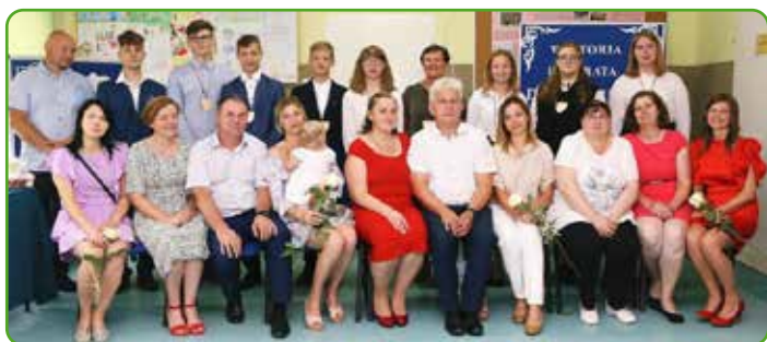
SP w Radomnie

Czego jeszcze oprócz wiedzy z podstawy programowej nauczył ten niezwykły rok? Na pewno samodyscypliny i systematyczności, ale także obycia z nowoczesnymi technologiami. Zdecydowanym mankamentem nauki zdalnej było odseparowanie od rówieśników.