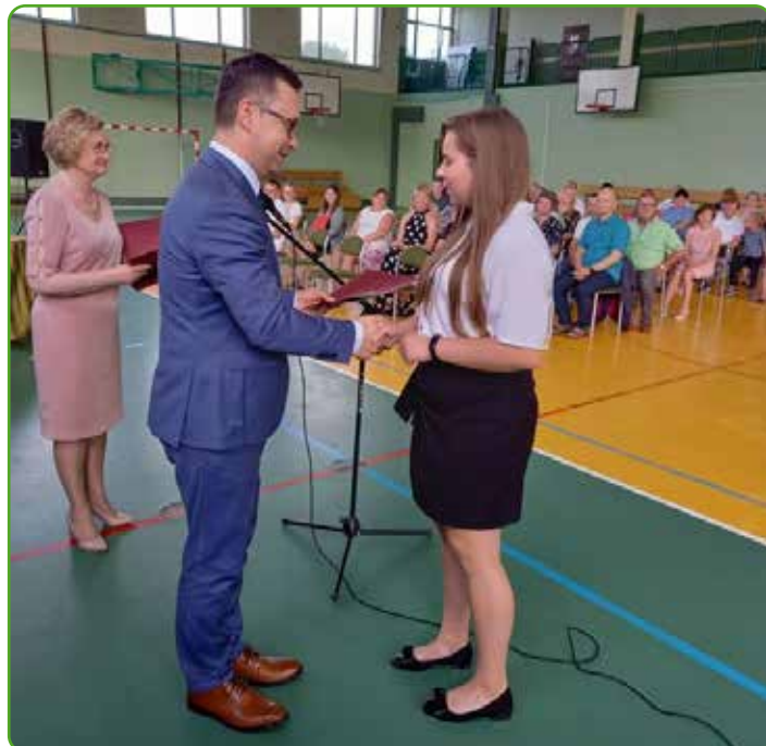
ZS w Bratanie_2