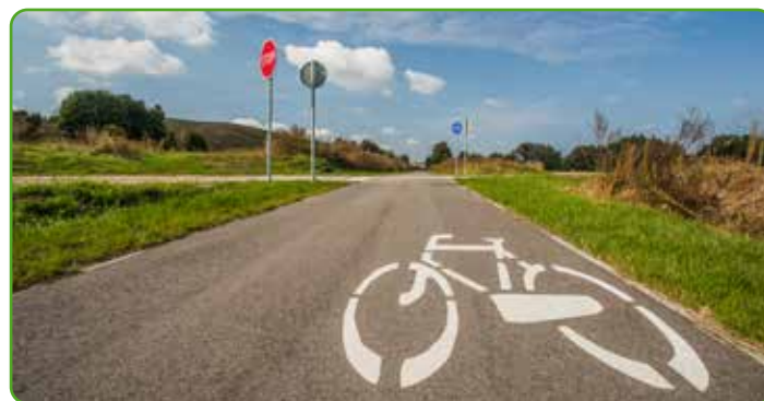
Powstanie nowa ścieżka rowerowa

Całkowita wartość projektu zgodnie z zawartym aneksem do umowy o dofinansowanie to ponad 4,5 mln zł, zaś pozyskana wysokość dofinansowania wynosi ponad 3,8 mln zł, tj. 85% wydatków kwalifikowalnych w projekcie.