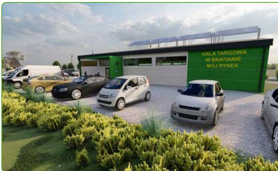
Na targ do Bratiana - wizualizacja

Docelowo hala ma być czynna dwa razy w tygodniu. Oprócz tego, w planach Gminy Nowe Miasto Lubawskie jest organizacja minimum raz w roku targów zdrowej i ekologicznej żywności, dzięki czemu umożliwimy lokalnym producentom dotarcie do szerszego kręgu odbiorców ich usług i produktów.