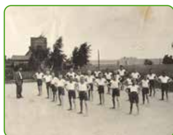
Dzień wychowania fizycznego

Spis powszechny w niepodległej już Polsce wspomina o wsi Jamielnik i osadzie Repetejki, które razem stanowiły gminę wiejską Jamielnik. Na zachód od Jamielnika notowano też przed wojną dwie małe osady Głodowo i Orłowo, widać je dokładnie na mapie z lat trzydziestych, zawiera je również spis powszechny z 1921 roku, obecnie te obszary porośnięte są lasem.