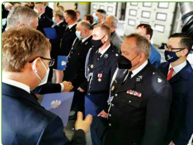
Promesy dla OSP Skarlin

którego szacunkowa cena to ponad 750 tys. zł, dlatego samochód prawie w połowie sfinansowany zostanie ze środków własnych Gminy Nowe Miasto Lubawskie. Również druhowie ze Skarlina dołożą swoją „cegielkę” do zakupu.