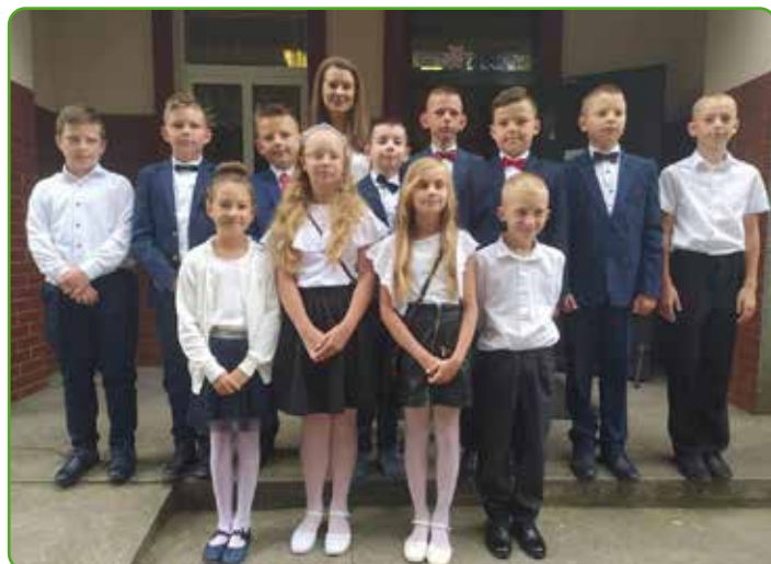
SSP w Tylicach