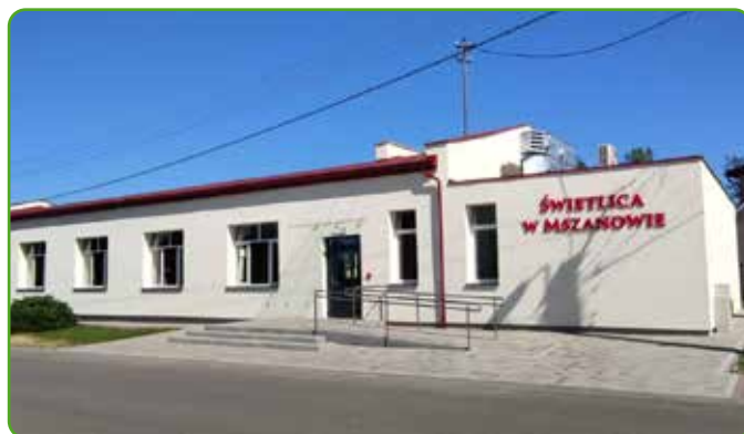
Zapraszamy do Mszanowa

Docelowo w budynku świetlicy odbywać się będą spotkania i uroczystości organizowane przez gminę, Gminne Centrum Kultury oraz inne jednostki.