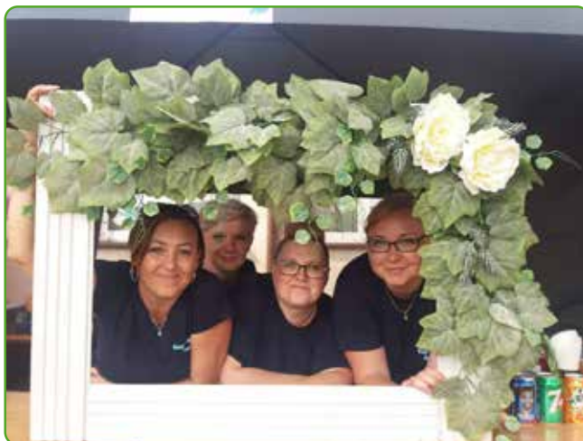
KGW Kogel-Mogel Jamielnik