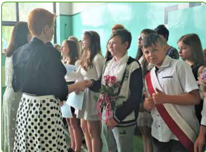
SP w Jamielniku