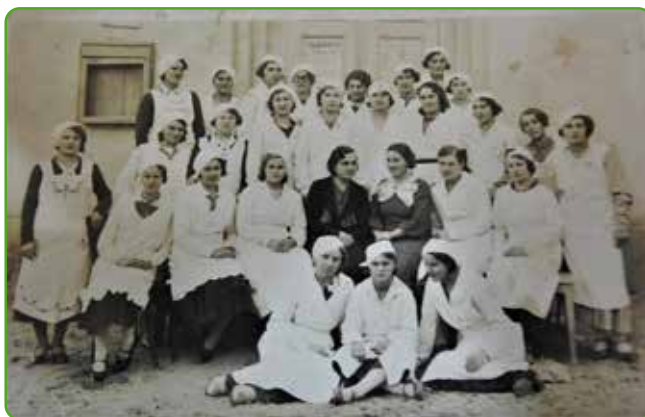
Kurs pieczenia ciast. Skarlin i Lekarty