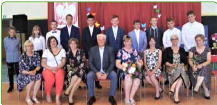
SP w Gwiździnach