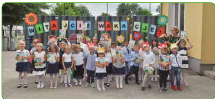
SP w Skarlinie

Dzieci i młodzież zakończyły rok szkolny 2020/2021. Nie da się ukryć, że był to rok wyjątkowy – niemal w całości uczniowie spędzili go nie w klasach, lecz na zajęciach zdalnych w swoich domach. Nie oznacza to jednak, że przysługiwały z tego tytułu taryfy ulgowe. Uczniowie nadal byli odpytywani z materiału, nauczyciele przeprowadzali też kartkówki oraz sprawdziany.