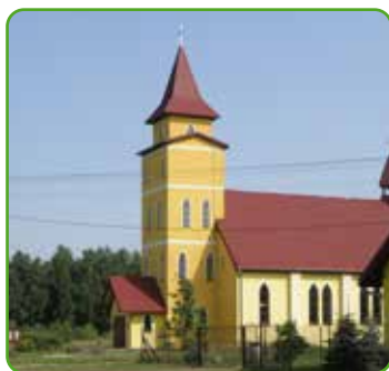
Kościół w Jamielniku

Od 1466 roku Jamielnik stanowił własność królewską w ramach starostwa bratiańskiego. Przez wiele lat wioska nie mogła się wydobyć z zapaści po wojnach z XIV wieku. Jakby tego było mało, w XVII wieku Jamielnik padł ofiarą pożogi wojennej, w wyniku czego zaginęły dokumenty lokacyjne wsi. Gdy w 1664 roku lustratorzy królewscy rozpoczęli lustrację wsi odnotowano, że wioska była prawie całkiem opuszczona – w całej wsi mieszkały tylko dwie rodziny. Dopiero za czasów pruskich wieś odrodziła się na nowo – opis z 1882 roku przekazuje, że mieszkało tutaj 387 osób – katolików, nie wspomina się ewangelików.