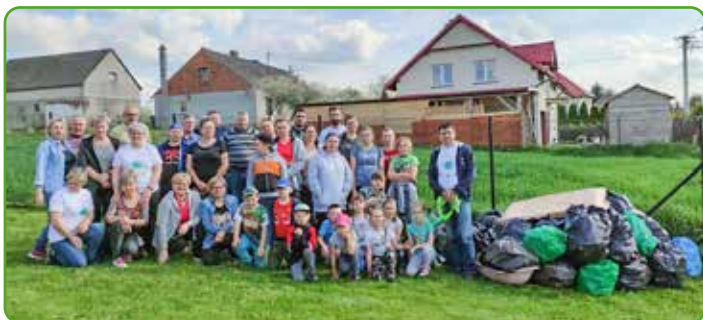
Sprzątanie Gminy 2021