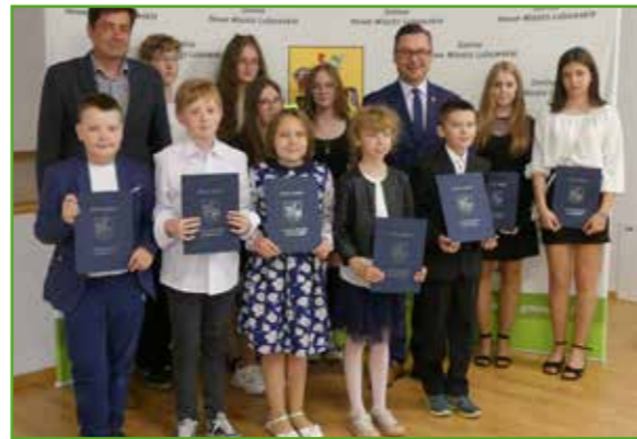
Wyróżnieni uczniowie z SP w Skarlinie

Tuż przed rozpoczęciem wakacji, w świetlicy wiejskiej w Mszanowie odbyło się spotkanie z uczniami szkół gminy Nowe Miasto Lubawskie, którzy osiągnęli bardzo wysokie wyniki w nauce. W tym roku wójt gminy ponownie zaprosił wszystkich uczniów z klas IV-VIII, których średnia ocen na świadectwie wyniosła 4,75 i więcej. Wśród zaproszonych znalazły się także osoby mogące pochwalić się szczególnymi osiągnięciami m.in. sportowymi. Na uroczystość, wraz z opiekunami, przybyło aż 117 dzieci! To niemal 1/3 wszystkich uczniów w tym przedziale klas z wszystkich gminnych szkół.