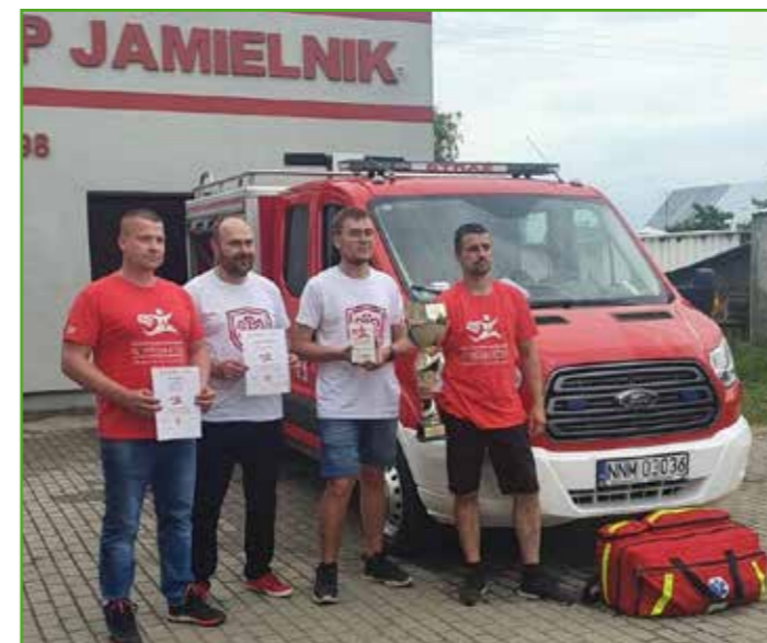
II miejsce OSP Jamielnik

W ostatecznej klasyfikacji reprezentanci Jamielnika zajęli II Miejsce w Polsce w kategorii Ochotniczych Straży Pożarnych.