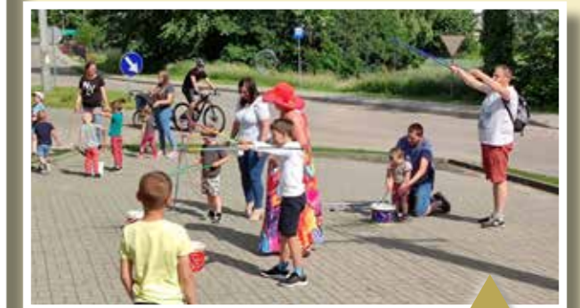
Nowy Dwór Bratiański