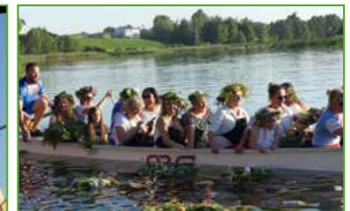
Puszczenie wianków ze smoczey łodzi