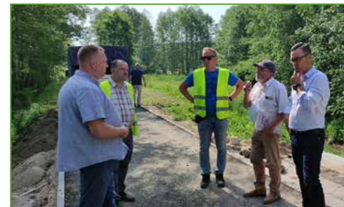
Wizyta na ścieżce

Sama ścieżka to nie wszystko. Projekt przewiduje również wykonanie miejsc postojowych z kostki betonowej dla rowerzystów i samochodów, ławek wypoczynkowych, stojaków na rowery oraz trzech wiat wyposażonych w ławy i stoły. Podobnie jak w Bratianie, zamontowany będzie także licznik zliczający rowerzystów.