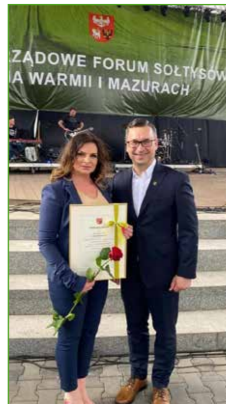
Wyróżniona sołtys z wójtem

Po dwuletniej przerwie Sołtysi z Warmii i Mazur ponownie spotkali się w ostródzkim amfiteatrze.