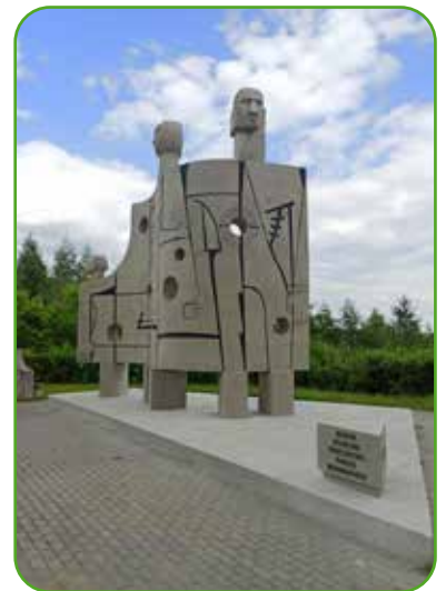
Pomnik w Nawrze „Ściana Śmierci”

Nie można oczywiście pominąć pomnika upamiętniającego ofiary hitleryzmu, stojącego na wzgórzu na granicy gminy Nowe Miasto Lubawskie i Nowego Miasta Lubawskiego. Pomnik w ostatnim czasie przeszedł renowację. Więcej o „Ścianie Śmierci” na naszej stronie www.gminanml.pl .