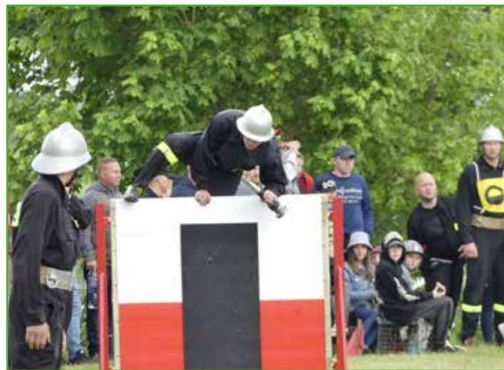
Zawody gminne w Tylicach

Drużyny, które zajęły trzy pierwsze miejsca wzięły udział w zawodach powiatowych w Kurzętniku. Drużyna męska z OSP Gwiżdżyny zajęła w klasyfikacji generalnej trzecie miejsce i będzie reprezentować naszą gminę na zawodach wojewódzkich. Tuż za podium uplasowali się druhowie z Chrośla. Do nich należał też najlepszy czas zawodów w konkurencji sztafety pożarniczej. Najlepsze z panów były drużyny z OSP Lekarty, które zakończyły rywalizację na siódmym miejscu.