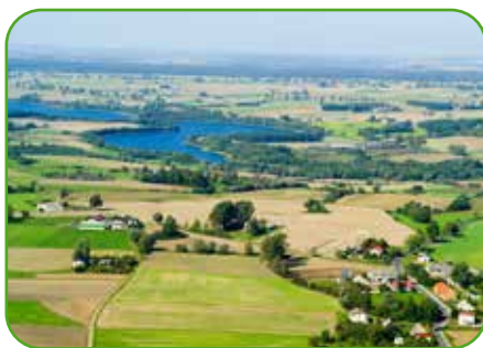
Nawra z lotu ptaka

W roku 1880 wieś zamieszkała była przez 368 mieszkańców (z czego 320 osób to katolicy, a 48 - ewangelicy). We wsi istniała szkoła.