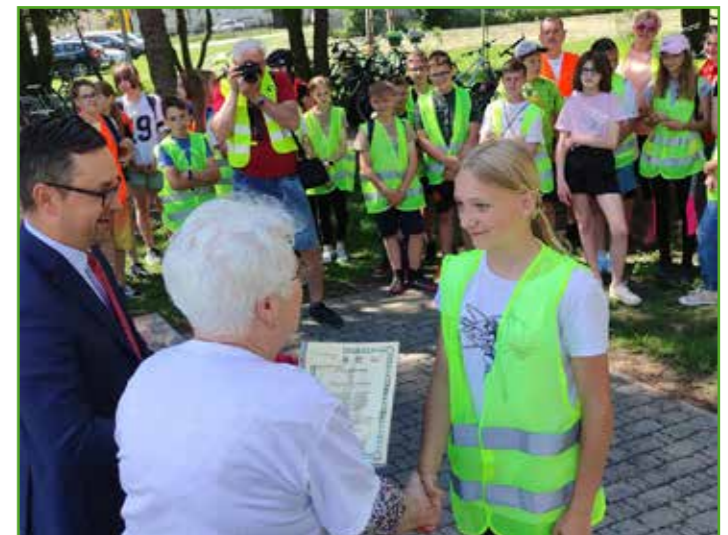
Dyplomy dla uczestników rajdu

Waraksiewicza w Mszanowie. Na uczestników czekała jednak jeszcze jedna niespodzianka - wspólne ognisko na przystani.