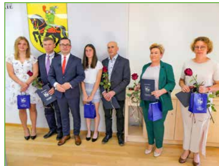
Nagrody dla sportowców

Po omówieniu sukcesów naszych mieszkank, nadszedł czas na kolejne punkty posiedzenia – głosowania nad udzieleniem wotum zaufania i absolutorium wójtowi gminy. Wyniki głosowania były jednogłośnie. Są one dowodem na to, że obrany kierunek rozwoju gminy jest słuszny, a podejmowane działania zyskują uznanie w oczach jej mieszkańców.