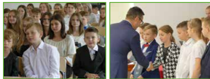
Uczniowie szkół Gminy Nowe Miasto na spotkaniu z wójtem.

Za swój trud włożony w zdobywanie wiedzy i osiągnięcia, oprócz gratulacji i słów uznania, każdy z wyróżnionych otrzymał pamiętkowy dyplom i upominek w postaci bonu zakupowego. Nagrody wręczył wójt Tomasz Waruszewski.