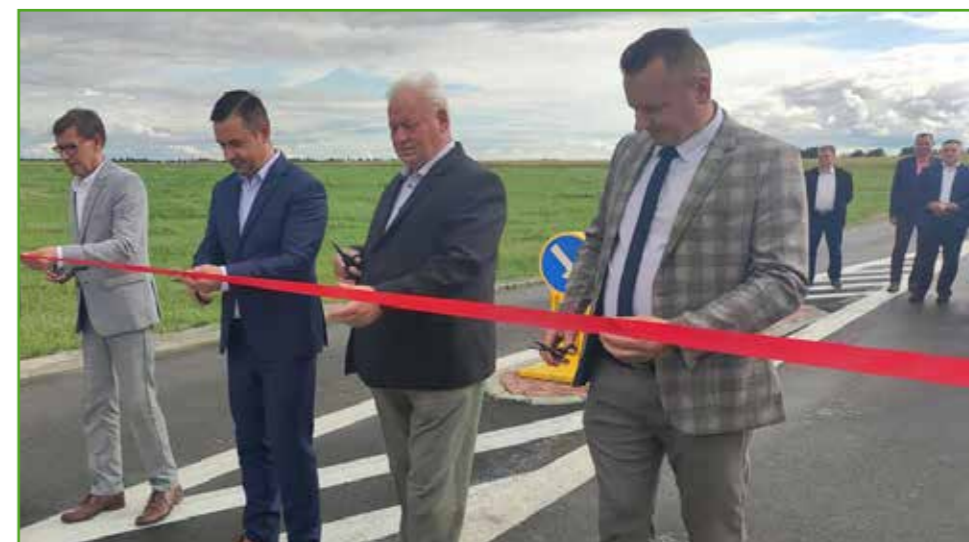
Otwarcie dróg w Nawrze

Do użytku łącznie przekazano ponad 2,5 km nawierzchni. W ramach inwestycji wykonano nawierzchnie o szerokości 5 metrów, zagospodarowano zjazdy na posesje, wykonano odwodnienie oraz nadano drogom prawidłowe oznakowanie. Na realizację zadań pozyskano dofinansowanie z Rządowego Funduszu Rozwoju Dróg w kwocie ponad 1,66 mln zł. Całkowita wartość inwestycji to ponad 2,8 mln zł.