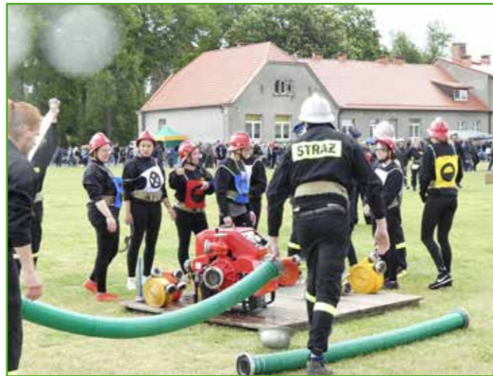
Zawody gminne w Tylicach

Gminne zawody sportowo-pożarnicze ponownie dostarczyły sporej dawki emocji. Czekali na nie prawie 3 lata nie tylko druhowie i drużyny, ale i wierni kibice. Nie dziwi zatem fakt, iż mimo deszczowej pogody na boisku szkolnym w Tylicach zgromadziło się wielu fanów sportowej strażackiej rywalizacji. Należy pamiętać, iż zawody nie są organizowane tylko po to, by pokazać która jednostka jest lepsza. To przede wszystkim sposób na sprawdzenie i przećwiczenie gotowości bojowej naszych druhów. Do tego celu świetnie nadają się takie konkurencje jak bieg sztafetowy i tzw. „bojówka” – obie bardzo widowiskowe.