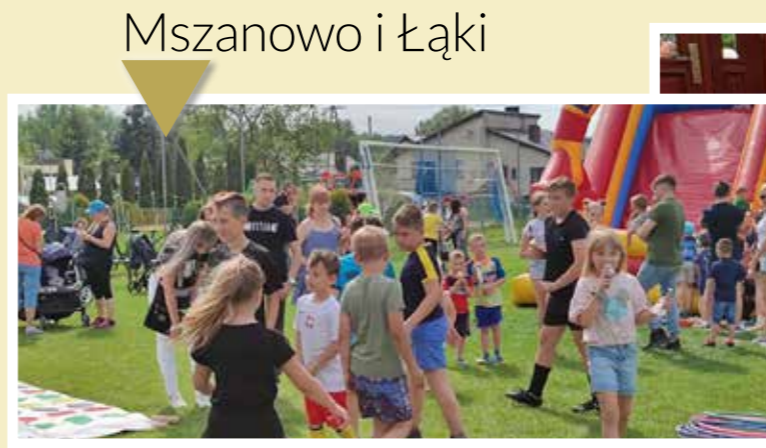
Mszanowo i Łąki