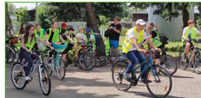
Rowerami do miejsc pamięci

W wyprawie wzięli udział uczniowie szkół podstawowych z naszej gminy, a także szkół z Nowego Miasta Lubawskiego. Odwiedzili oni miejsca pamięci zlokalizowane na terenie gminy oraz miasta. Podsumowanie rajdu odbyło się przy pomniku gen.