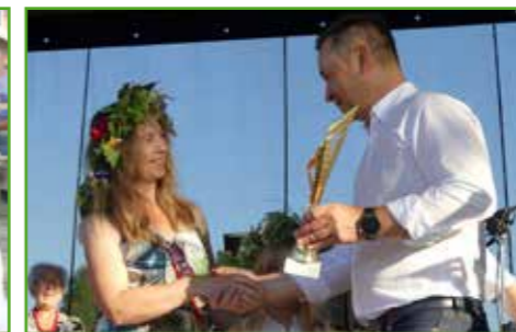
Wręczenie nagród w konkursie wiankowym