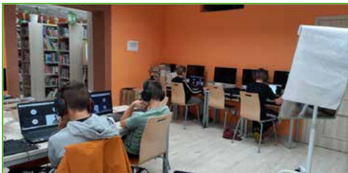
Sprzęt dla bibliotek

Miła przesyłka trafiła do naszych bibliotek. Dzięki udziałowi w projekcie „Sieć na kulturę w podregionie elbląskim” otrzymały one 4 laptopy i 2 tablety. Ponadto, w ramach projektu odbyły się szkolenia dla pracowników instytucji, a także kursy projektowania graficznego dla dzieci.