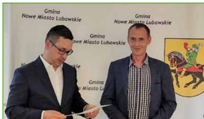
Wójt gminy z laureatem III miejsca

Zapraszamy do udziału w drugiej edycji „Mieszkam, melduję, wygrywam”. Konkurs skierowany jest do osób fizycznych, które dostarczą do Urzędu Gminy Nowe Miasto Lubawskie wypełniony formularz zgłoszeniowy, w którym w kilku zda-