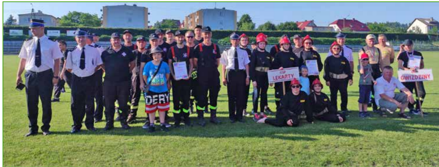
Nasze drużyny na zawodach powiatowych w Kurzętniku

Gminne zawody sportowo-pożarnicze ponownie dostarczyły sporej dawki emocji. Czekali na nie prawie 3 lata nie tylko druhowie i drużyny, ale i wierni kibice. Nie dziwi zatem fakt, iż mimo deszczowej pogody na boisku szkolnym w Tylicach zgromadziło się wielu fanów sportowej strażackiej rywalizacji. Należy pamiętać, iż zawody nie są organizowane tylko po to, by pokazać która jednostka jest lepsza. To przede wszystkim sposób na sprawdzenie i przećwiczenie gotowości bojowej naszych druhów. Do tego celu świetnie nadają się takie konkurencje jak bieg sztafetowy i tzw. „bojówka” – obie bardzo widowiskowe.