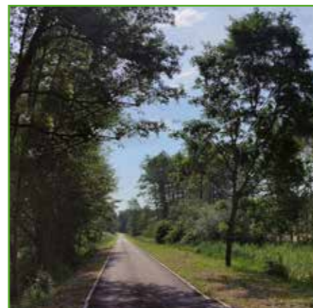
Wizyta na ścieżce

Ścieżka ma swój początek w pobliżu skrzyżowania z budowaną obecnie obwodnicą Nowego Miasta Lubawskiego w Pacóttowie i biegnie drogą po byłej linii kolejowej nr 260 Nowe Miasto Lubawskie - Zajączkowo Lubawskie do granicy z Gminą Grodziczno. Koniec trasy zlokalizowany jest pomiędzy jeziorami „Górnym” i „Środkowym” w Tylicach.