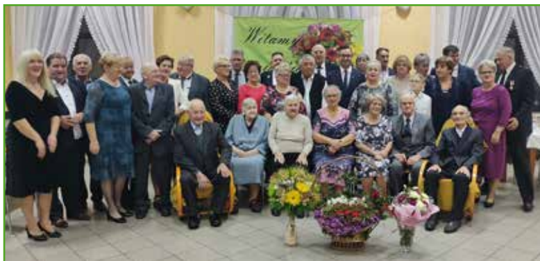
Dzień Seniora w Chroślu

Październik i listopad to miesiące, które w naszej gminie zdecydowanie należą do Seniorów. W spotkaniach przygotowanych przez sołectwa uczestniczą mieszkańcy, którzy wspólnie świętują Ogólnopolski Dzień Seniora.