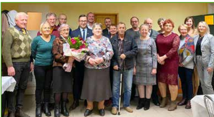
Dzień Seniora w Gryźlinach

* Już po oddaniu Biuletynu do druku Dzień Seniora odbył się także w sołectwach Lekarty i Skarlin. Świętował także Klub Seniora Gminy Nowe Miasto Lubawskie.