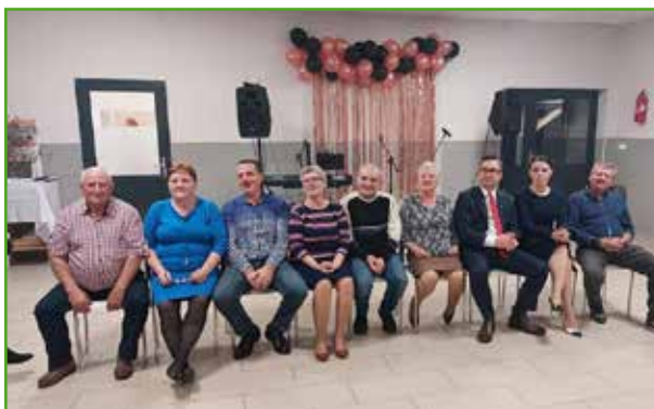
Dzień Seniora w Bagnie

* Już po oddaniu Biuletynu do druku Dzień Seniora odbył się także w sołectwach Lekarty i Skarlin. Świętował także Klub Seniora Gminy Nowe Miasto Lubawskie.