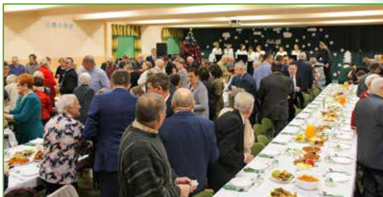
Wigilia w 2016 r.