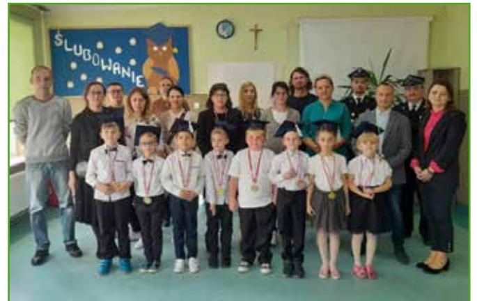
Ślubowanie w SP w Radomnie - 8 uczniów