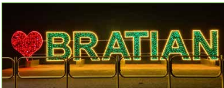
Neon na powitanie

Element serca jest wymienny. Pierwsza zmiana już wkrótce.