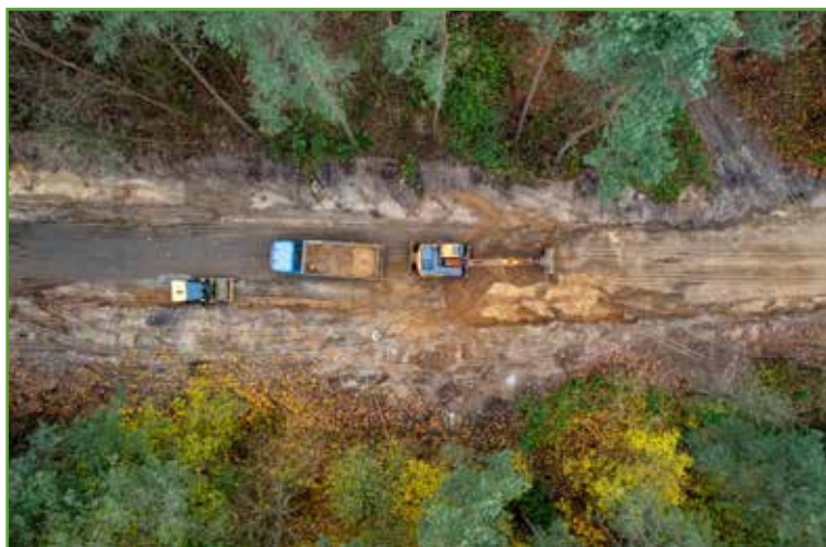
Budowa drogi Mszanowo-obwodnica Nowego Miasta Lubawskiego