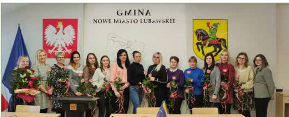
Pracownicy Ośrodka Pomocy Społecznej