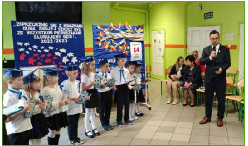
Ślubowanie w SSP w Tylicach - 10 uczniów (na zdj. jeden nieobecny)