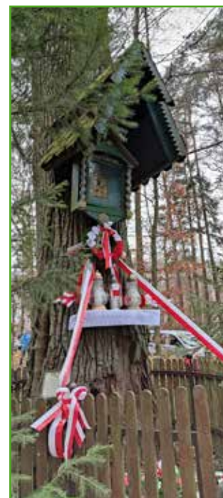
Kapliczka Trzy Dęby

przypomina nam, że pomimo wszystkich dzielących nas różnic, łączy nas wspólne nadzieje i marzenia. Jeszcze raz uwierzmy w ideały, które jednoczyły naszych przodków – w odwagę by łączyć i nadzieję na lepszą przyszłość. Zaczniemy je wprowadzać choćby dziś, z radosną pieśnią zwycięstwa na ustach.