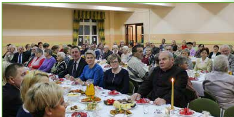
Wigilia w 2019 r.

O tym, jak wyjątkowe są nasze spotkania wigilijne świadczą zdjęcia z minionych lat.