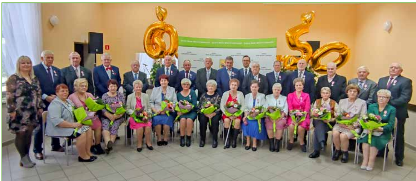
U honorowani Medalami Za Długoletnie Pożycie Małżeńskie

Dziękujemy również paniom z KGW Chrośle za pomoc w przygotowaniu uroczystości.