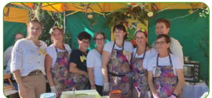
Koło Gospodyń Wiejskich Pacóttowo

Obecnie sołectwo Pacóttowo liczy sobie 720 mieszkańców. We wsi znajduje się świetlica, w której odbywają się spotkania mieszkańców podczas takich wydarzeń jak Dzień Seniora czy Dni Rodziny. Od kilku lat organizowany jest również Bieg Pacóttowski, którego trasa przebiega wokół malowniczych pagórków. Tereny te można również podziwiać podczas wycieczki nową ścieżką rowerową na odcinku Pacóttowo-Tylce.. We wsi aktywnie działa również koło gospodyń wiejskich. W Pacóttowie znajduje się także Dom Dziecka prowadzony przez jednostkę samorządu terytorialnego - Starostwo Powiatowe w Nowym Mieście Lubawskim.