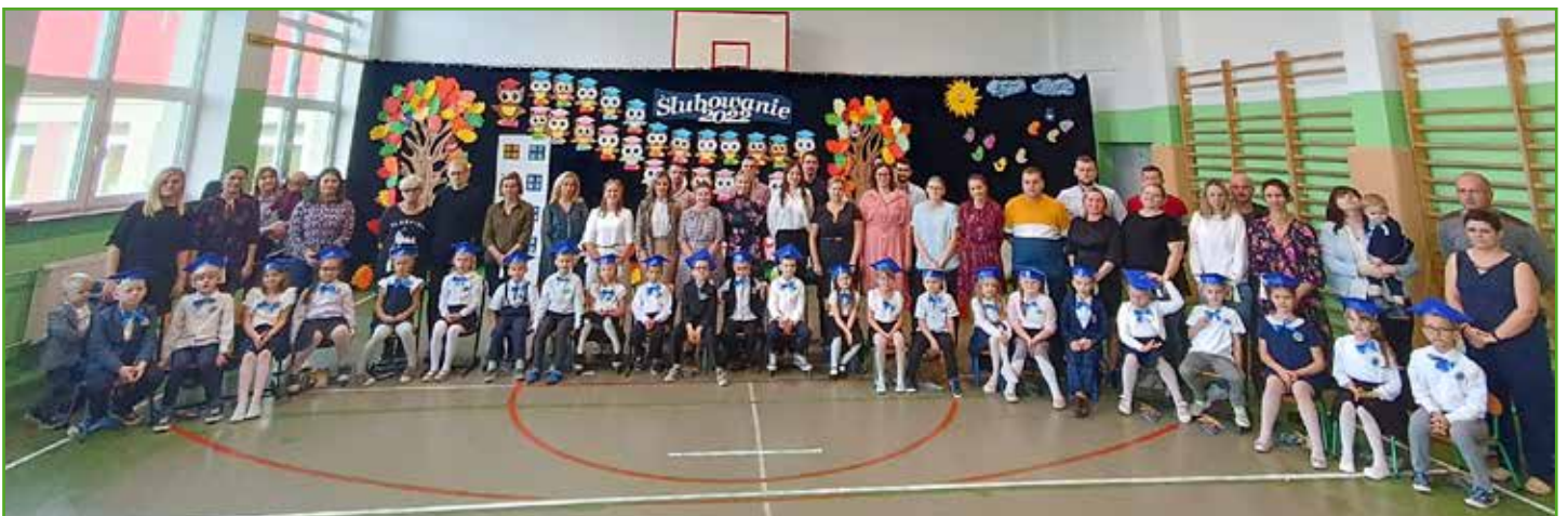
Ślubowanie w SP w Jamielniku - 24 uczniów