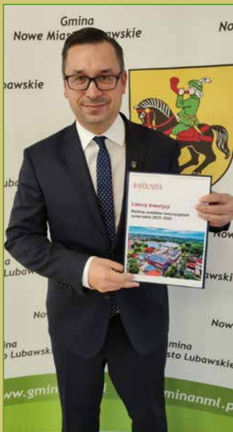
Najlepsi w powiecie

Najnowszy ranking magazynu „Wspólnota” pokazuje, że Gmina Nowe Miasto Lubawskie jest liderem wydatków inwestycyjnych w Powiecie Nowomiejskim oraz zajmuje piąte miejsce w województwie warmińsko-mazurskim.