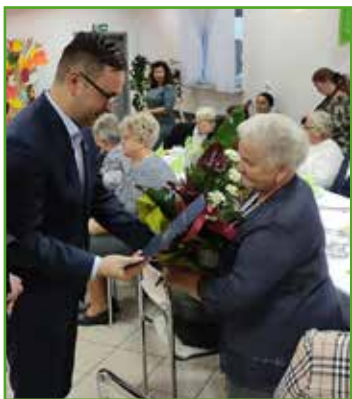
Dzień Seniora w Jamielniku

Październik i listopad to miesiące, które w naszej gminie zdecydowanie należą do Seniorów. W spotkaniach przygotowanych przez sołectwa uczestniczą mieszkańcy, którzy wspólnie świętują Ogólnopolski Dzień Seniora.