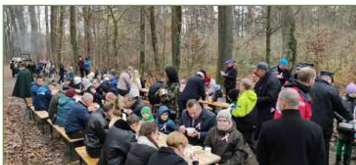
Grochówka w lesie