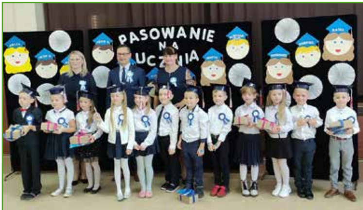
Ślubowanie w SP w Skarlinie - 12 uczniów