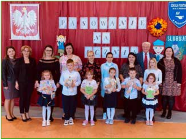
Ślubowanie w SP w Gwiździnach - 6 uczniów