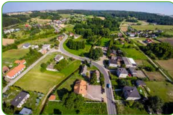
Pacóttowo z lotu ptaka

W okresie międzywojennym wieś rozwijała się dość dobrze i w 1928 roku władze kościelne postanowiły wyłączyć Pacóttowo z parafii Kurzętnik i utworzyć samodzielną parafię, obejmującą tylko tę wieś. Początkowo proboszczem był ksiądz Nowego Miasta Lubawskiego. Planowano także zbudować nowy kościół.