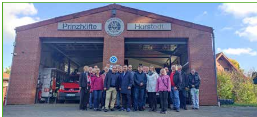
Z wizytą u strażaków

Celem współpracy, do której zmierzają obie gminy jest nie tylko wymiana młodzieży, ale również inne, istotne dla obu samorządów kwestie między innymi związane z wymianą doświadczeń w dziedzinie ochrony środowiska i przedsiębiorczości, na polu działania ochotniczych straży pożarnych, sportu, edukacji i kultury.