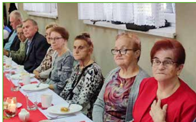
Dzień Seniora w Pacóttowie