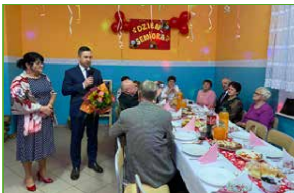
Dzień Seniora w Radomnie