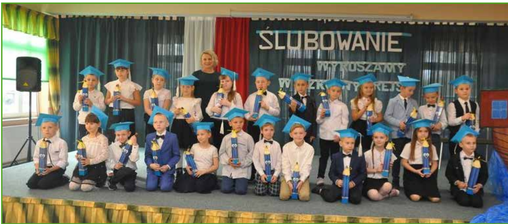
Ślubowanie w ZS w Bratianie - 24 uczniów