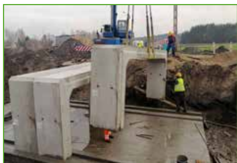
Budowa przepustu na drodze Pustki - Chrośle