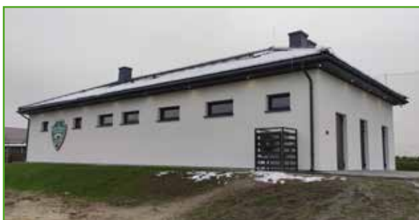
Szatnia i siłownia w Radomnie

Przed nami również dwie bardzo duże inwestycje: budowa dwóch mostów na rzece Wel w Bratianie oraz budowa remizy wraz ze świetlicą w tejże miejscowości. W planach są także prace z zakresu gospodarki wodno-kanalizacyjnej na terenie gminy.