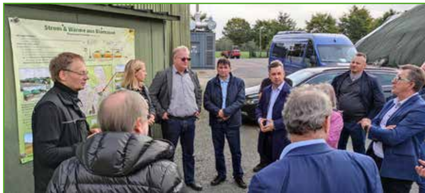
Harpstedt - biogazownia